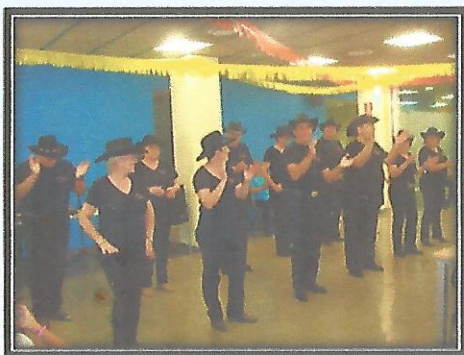
GRUP COUNTRY "CRAZY BOOTS"