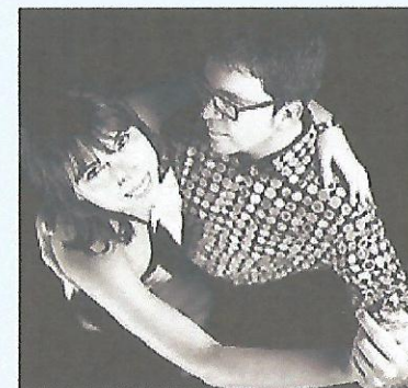
SUNSI I ARCADI