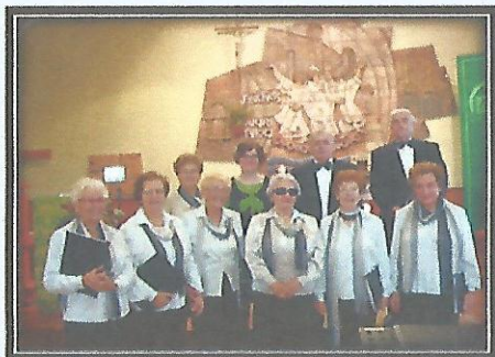
CORAL SANT MAGÍ